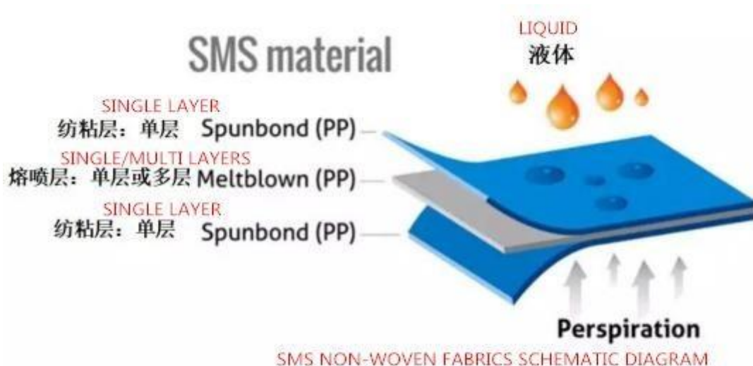
图 1: SMS 无纺布结构示意图

Материал SMS: 1 слой – нетканый ПП; 2 слой -мелблана, 3-й один слой – нетканый ПП.