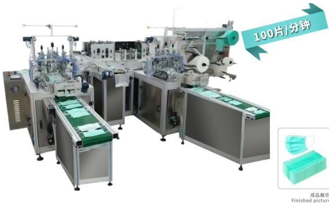
Таблица параметров оборудования